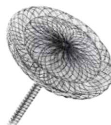
Безвтулочный окклюдер ООО